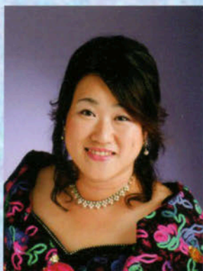
メゾソプラノ 葉谷佳苗