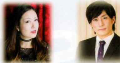
羽田兔桃(兔桃企画) 松永和也

子育て用アンドロイドと、彼に育てられた女の子。 無機物と有機物。 一体と一人。 実験と考察と。 その結果…………… 貴方にとって「FAMILY」とは何ですか？